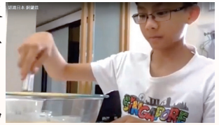
網上差傳活動「世界廚房」

播差重視異象推廣及各個年齡層的差傳教育，致力在各堂孕育堂會及個人宣教心。右圖便是同工於堂會舉辦網上活動「世界廚房」及「宣教學堂」。播差也不時應邀到播道會堂會分享差傳信息，激勵弟兄姊妹積極參與宣教。