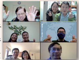
「歐洲工場宣教士祈禱會」

1. 播差同工正透過視訊平台關心宣教士，定期舉辦「亞洲工場宣教士祈禱會」及「歐洲工場宣教士祈禱會」，凝聚宣教士彼此相交守望，以禱告承托各地宣教。